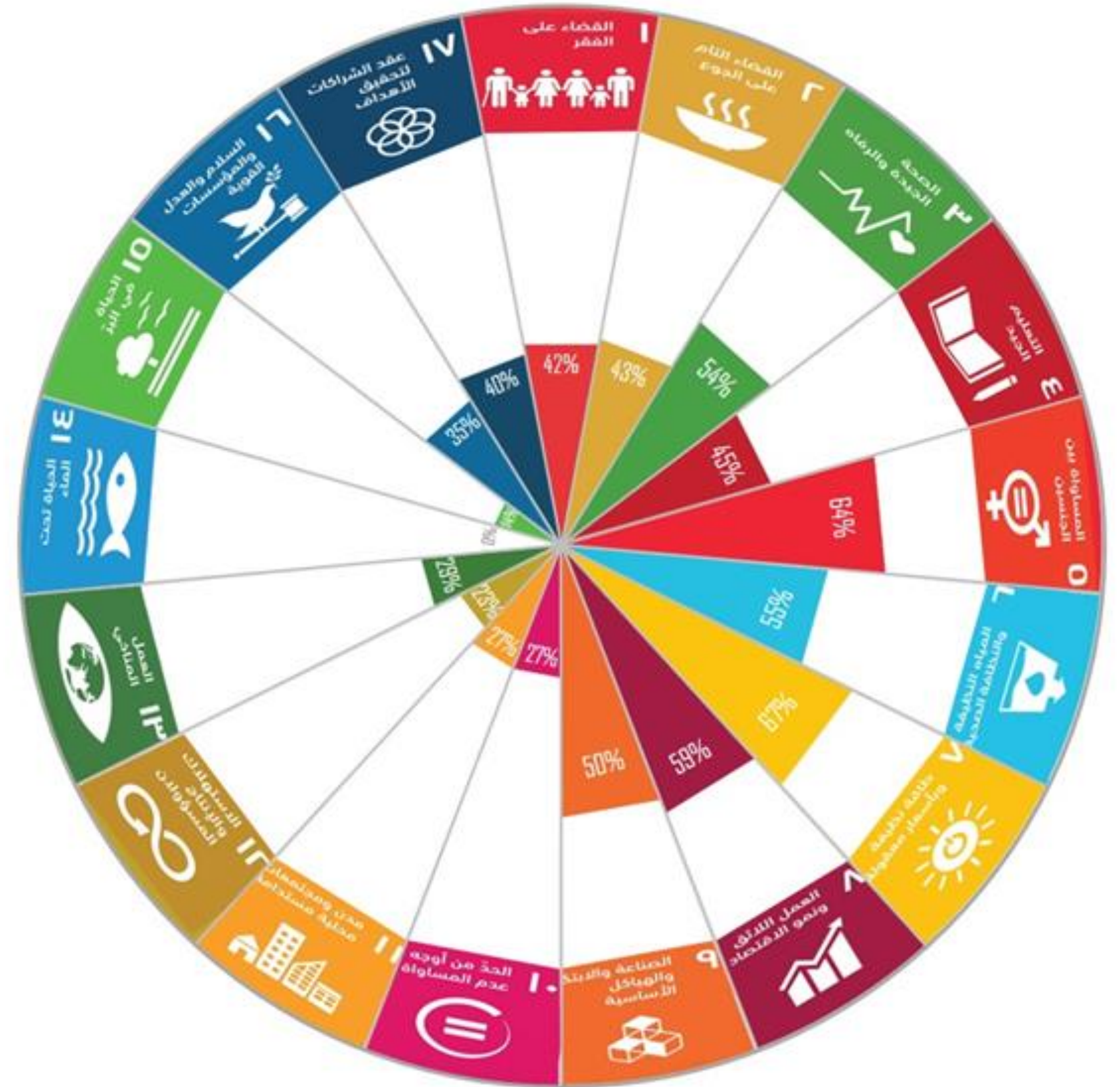
نسبة مؤشرات التصنيف الاول Tier 1 لكل هدف